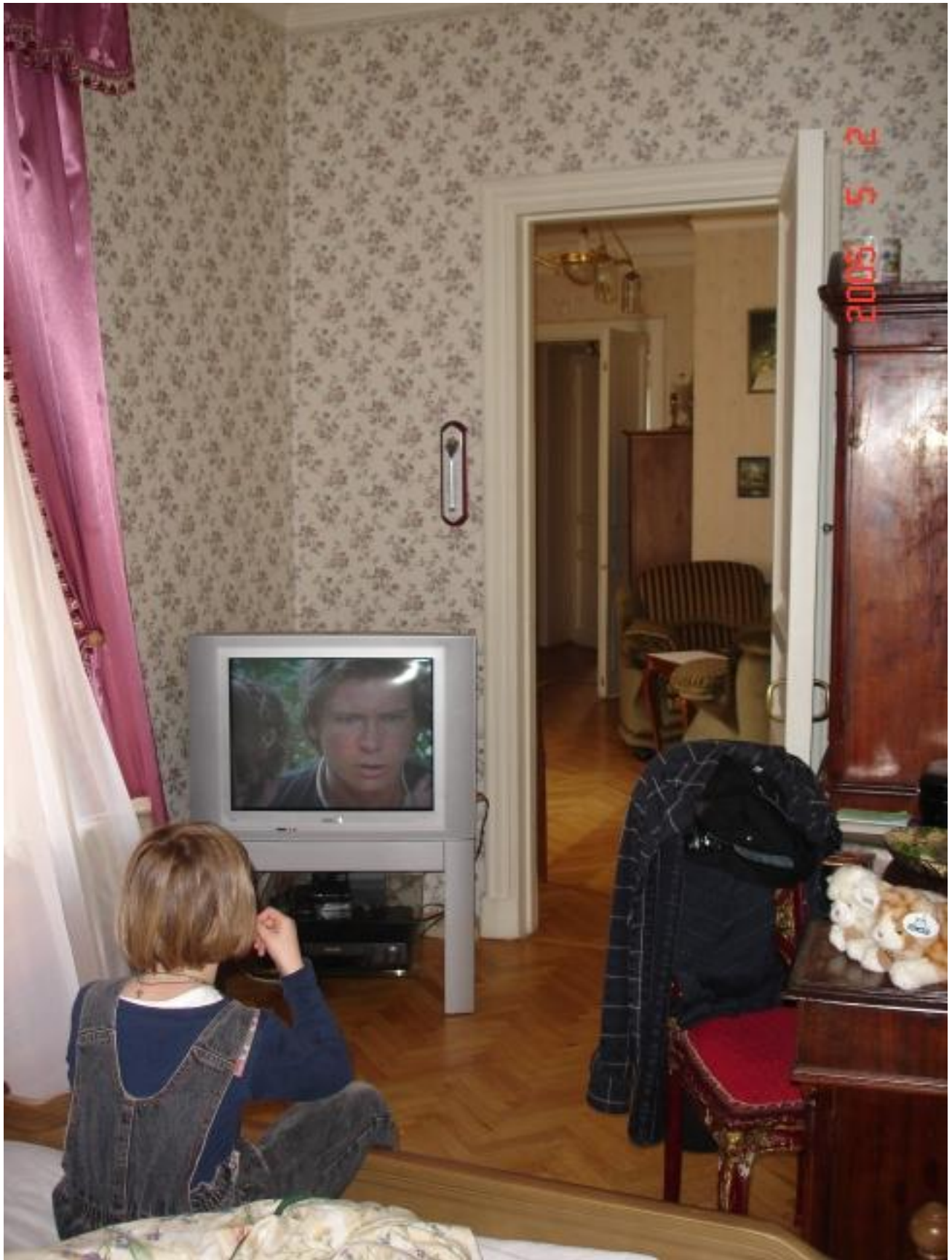
Sleeping room with TV