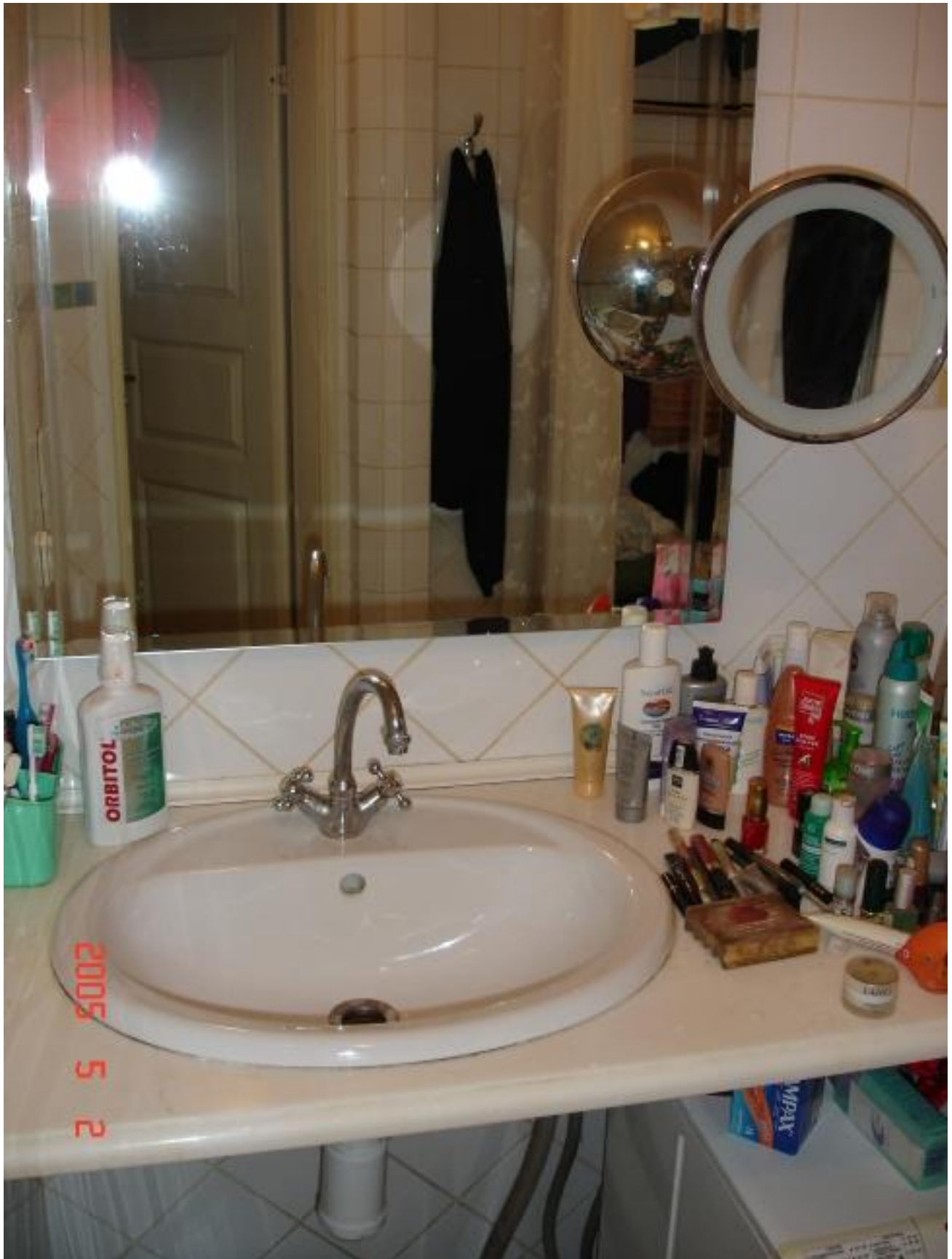
Bathroom with bathtub/shower