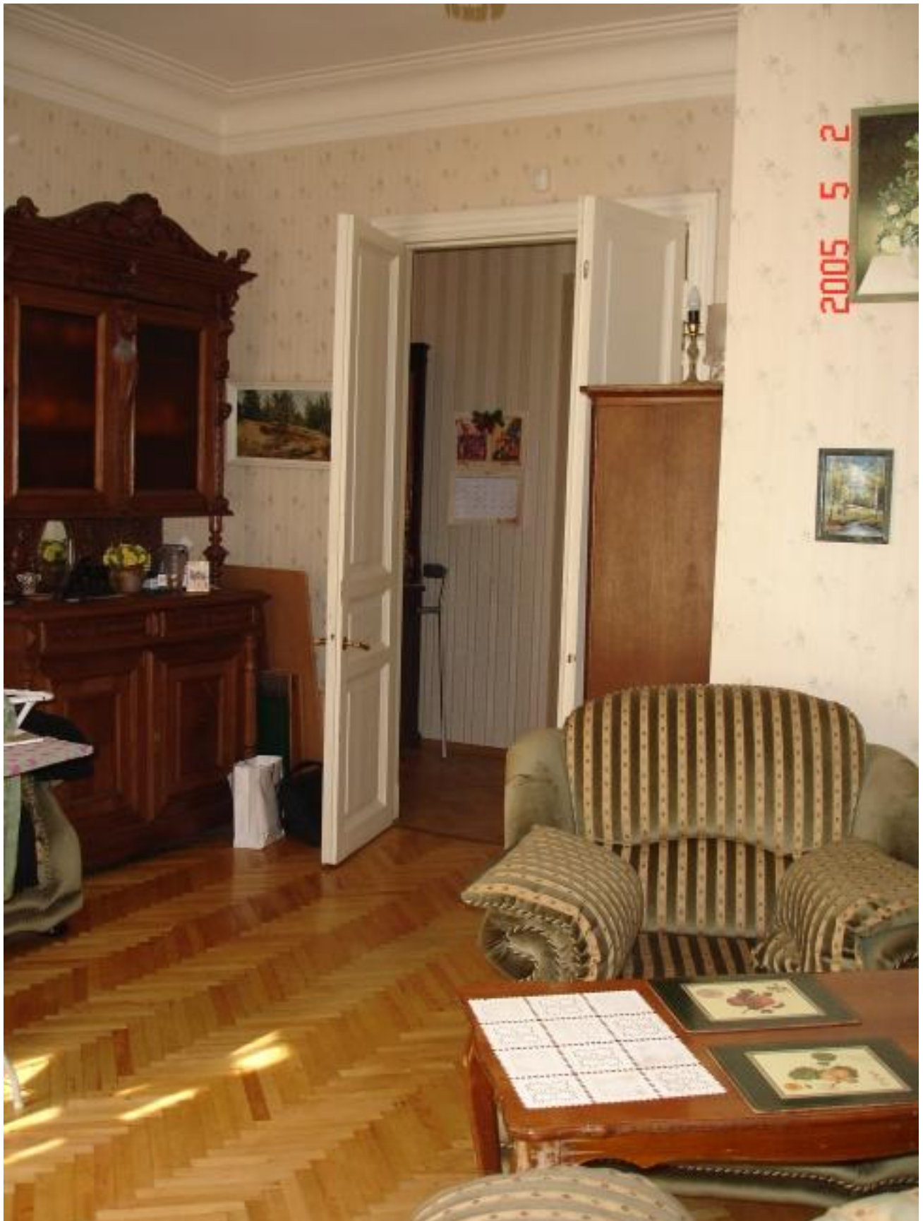
Living room with chimney