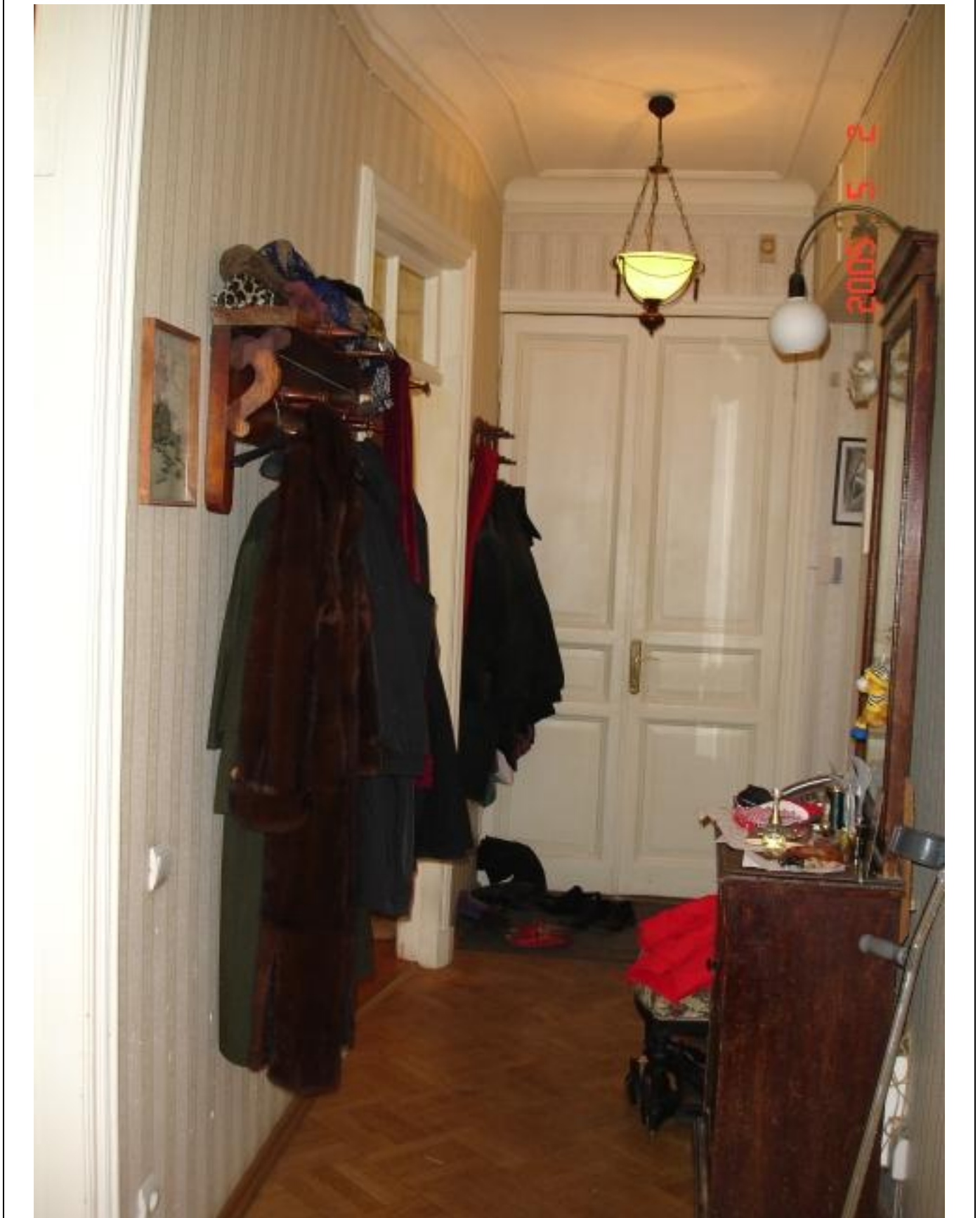
Entrance and corridor